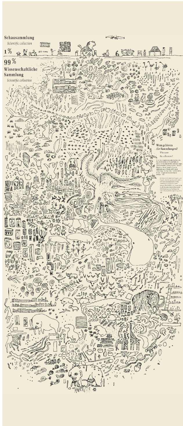
Grafik: Benjamin Haid