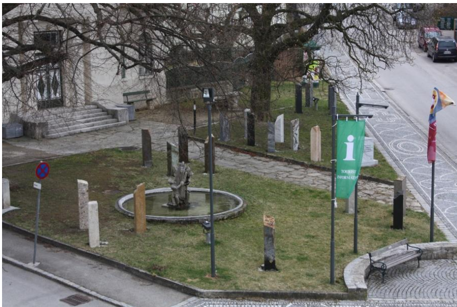
Gesteinspark vor dem Krahuletz-Museum